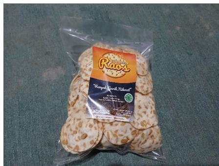
Gambar 2. Produksi keripik tempe di salah satu UMKM

Bahan baku utama yang digunakan dalam produksi keripik tempe adalah tempe berbahan dasar kedelai impor maupun kedelai lokal. Pelaku usaha cenderung memilih tempe dengan kualitas tekstur padat dan fermentasi optimal agar menghasilkan keripik yang renyah serta tidak mudah hancur saat proses penggorengan (Kusumah, et al. 2025). Proses produksi keripik tempe pada umumnya diawali dengan pembuatan tempe melalui tahapan perebusan kedelai, perendaman, fermentasi, dan pencetakan, kemudian dilanjutkan dengan pengirisan tipis sebelum dilakukan penggorengan. Produksi tempe yang digunakan sebagai bahan baku keripik masih banyak dilakukan menggunakan metode tradisional dengan kontrol sanitasi yang belum optimal. Penelitian Suwardi et al. (2022) menyatakan bahwa produksi tempe pada UMKM umumnya masih menggunakan metode konvensional dan belum sepenuhnya menerapkan teknologi modern dalam proses pengolahan sehingga kualitas produk dapat bervariasi.