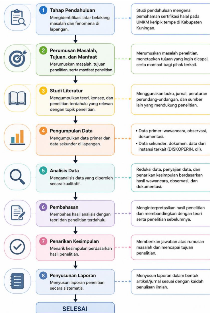
Gambar 1. Diagram Alir Tahapan Penelitian

Penelitian ini menggunakan metode penelitian kualitatif dengan pendekatan deskriptif. Metode ini digunakan untuk memperoleh gambaran secara mendalam mengenai pemahaman pelaku UMKM keripik tempe terhadap sertifikasi halal serta kendala yang dihadapi dalam proses pengajuan sertifikasi halal. Pendekatan deskriptif dipilih karena penelitian berfokus pada pengungkapan fenomena berdasarkan kondisi nyata di lapangan melalui hasil wawancara, observasi, dan dokumentasi (Pebrianti, et al. 2021). Penelitian dilaksanakan pada bulan Februari hingga Juni 2024 di beberapa UMKM keripik tempe yang berada di Kabupaten Kuningan, Jawa Barat. Penentuan lokasi penelitian dilakukan secara purposive dengan mempertimbangkan bahwa Kabupaten Kuningan merupakan salah satu daerah penghasil keripik tempe dengan jumlah UMKM yang cukup banyak dan sebagian pelaku usahanya telah maupun sedang mengajukan sertifikasi halal. Subjek penelitian terdiri atas pemilik dan produsen UMKM keripik tempe di Kabupaten Kuningan. Pengambilan sampel dilakukan menggunakan teknik purposive sampling , yaitu pemilihan responden berdasarkan kriteria tertentu yang sesuai dengan tujuan penelitian. Jumlah responden yang diwawancarai sebanyak enam pelaku usaha keripik tempe yang aktif melakukan produksi dan pemasaran produk.